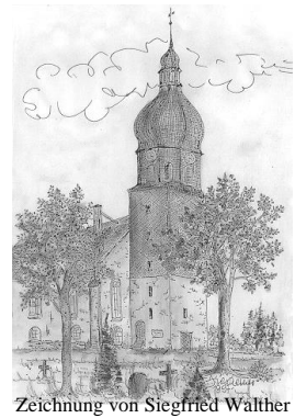
Zeichnung von Siegfried Walther

Wir würden uns freuen, wenn sie mit Ihrer Spende bzw. Ihrer Mitgliedschaft unsere Arbeit unterstützen würden.