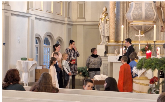
Eltern und Kinder der Christenlehre bedankten sich.